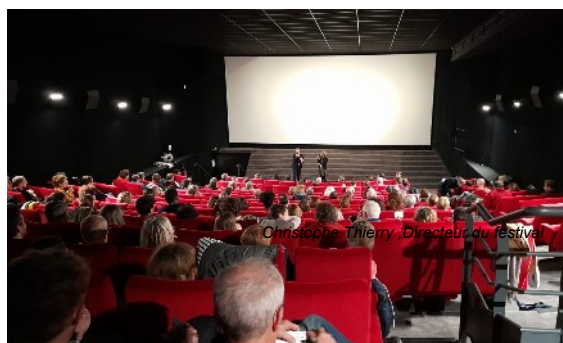
Soirée Omnia , novembre 2023

En novembre 2024, pour sa 13 ème édition, le festival THIS IS ENGLAND s'installe au cœur du paysage culturel et éducatif rouennais et normand, en proposant une sélection de 58 courts-métrages en version originale sous-titrée (VOST). Du 16 au 24 novembre 2024, le public pourra découvrir des écritures cinématographiques variées, inhabituelles.