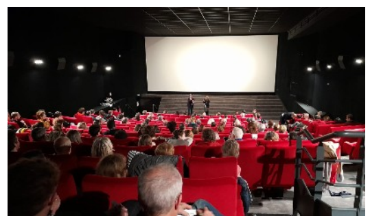
Soirée Omnia , novembre 2023

En novembre 2025, pour sa 14ème édition, le festival THIS IS ENGLAND s'installe au cœur du paysage culturel et éducatif rouennais et normand, en proposant une sélection de 49 courts-métrages en version originale sous-titrée (VOST). Du 15 au 23 novembre 2025, le public pourra découvrir des écritures cinématographiques variées, inhabituelles.